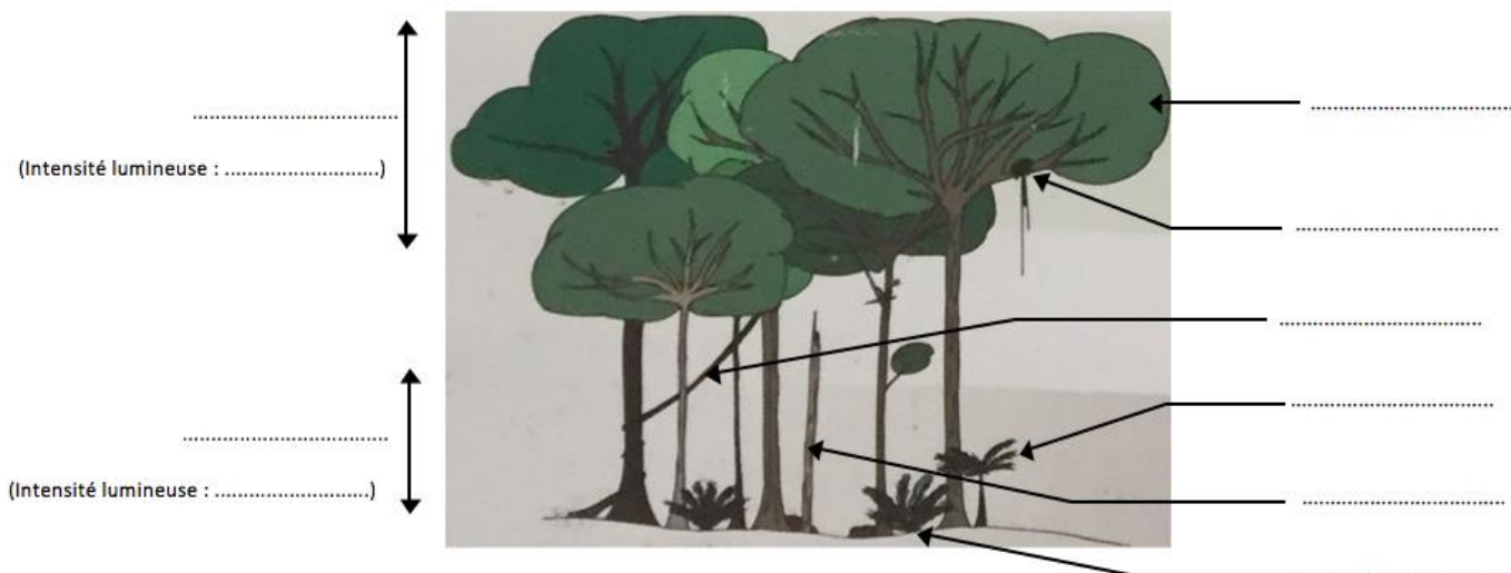
Schéma de la structure de la forêt tropicale